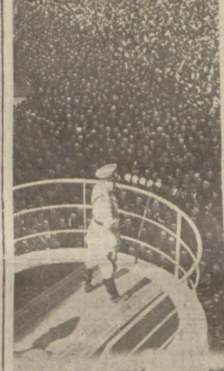
Mussolini faşist partisi üyelerine nutuk söylerken

Moskova 4 (A.A.) — Röyter: Sovyet tebliğine ek: