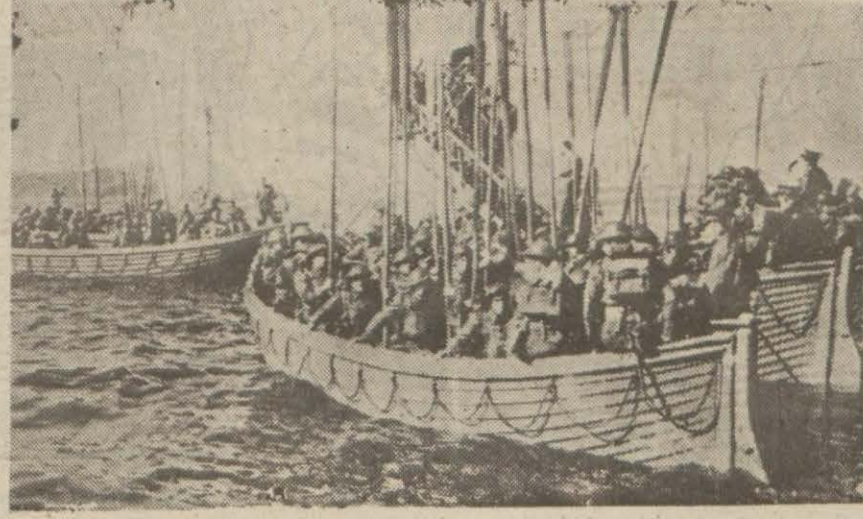
Bir ihrac teşebbüsü esnasında karaya çıkarılan İngiliz askerleri

Berlin 4 (A.A.) — Dün gece, İngiliz bomba uçakları, Hamburg'da halkla mesken mahalleler üzer-