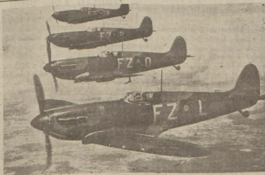
İngiliz Spitfire tayareleri bir akın esnasında

Tokyo 4 (A.A.) — Domei ajansının bildirdiğine göre, Şantung eyaletinin batı bölgesinde ve Ho-pey eyaletinin cenub batı kasimlerinde Çarşamba günü başlayan geniş hareket neticesinde 50 bin kişilik Çunking ve komünist kuvvetler (Devamı 5 inci sayfada)